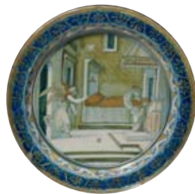
"Annunciazione", piatto in maiolica, bottega del maestro Giorgio, Gubbio 1526.

Il potere e il mistero esercitato dagli spazi domestici nell'immaginario collettivo è indagato nella rassegna "La casa surreale" attraverso una selezione di suggestive opere. Dall'inquietante "Casa vicino alla ferrovia" del 1925 di Edward Hopper, che ha ispirato la casa sulla collina sopra il Bates Motel di Alfred Hitchcock in "Psycho", girato nel 1960, alla finestra "fresca vedova" di Duchamp, che nasce dal gioco di parole inglesi window (finestra) e widow (vedova) a "l'anarchico concerto" suonabile dal pianoforte sospeso (1990) di Rebecca Horn.