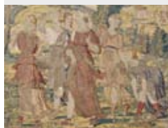
Arazzo di W. de Pannemaker, Bruxelles 1570.

Madrid Museo Nacional del Prado; tel. 0034-91-3302800. Dall'1 giugno al 26 settembre. La serie degli amori di Mercurio ed Erse, tessuta da Willem de Pannemaker (eccelso maestro arazziere del Rinascimento fiammingo) nella metà del XVI secolo è presentata in "Willem de Pannemaker. La serie di Mercurio". In mostra sono riuniti gli otto arazzi mitologici, ora dispersi tra collezioni pubbliche e private.