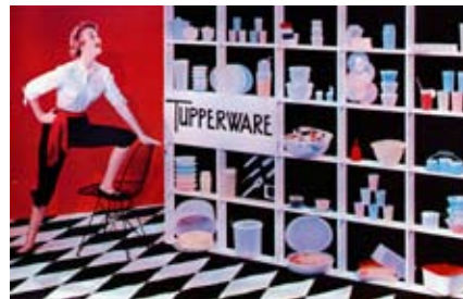
Invito a una dimostrazione casalinga della Tupperware, intorno al 1958.

Quando, verso la fine degli Anni 40, Earl Silas Tupper (1907-1983) lanciò sul mercato statunitense il suo primo prodotto, la famosa "Ciotola Meraviglia", realiz-