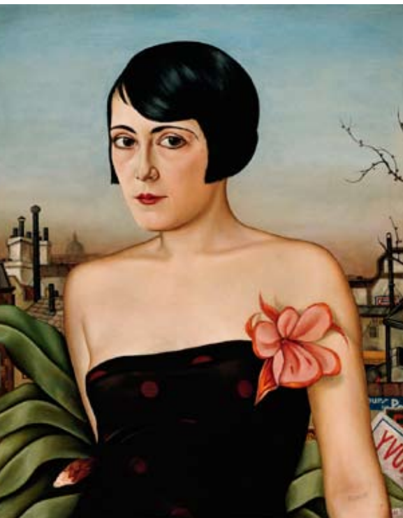
A SINISTRA: "Maika", 1929, olio su tela di Christian Schad (1894-1982). SOTTO: "Primo denaro", 1928, olio su tavola di Cagnaccio di San Pietro (1897-1946). Due dipinti in mostra a Monaco. IN BASSO: oro e granati per gli amorini su delfino, I secolo d.C., provenienti dal sito di Tillya Tepe (a Bonn).