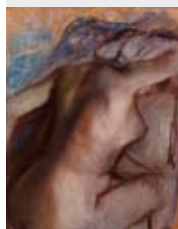
"Donna nuda che si asciuga la nuca", 1884, un pastello di Degas.

Dopo la chiusura per interventi di restauro, riapre i battenti l'Albertinum di Dresda, edificio rinascimentale costruito tra il 1559 e il 1563 da Melchior Trost e Paul Buchner su progetto di Caspar Voigt. Ampliato in maniera sostanziale, il nuovo Albertinum ospita ora due dei musei più importanti della città: la collezione delle sculture (Skulpturensammlung) e la Pinacoteca dei Maestri moderni (Galerie Neue Meister), offrendo una panoramica sull'arte figurativa degli ultimi 200 anni.