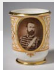
Tazza con ritratto di Carlo XV, re di Svezia e Norvegia, anonimo.

Stoccolma Nationalmuseum; tel. 0046-8-51954300. Dal 16 giugno al 23 gennaio. Attuale famiglia reale di Svezia, la Casata di Bernadotte è al trono dal 1818. Con la rassegna celebrativa "I Bernadotte in bianco e nero" il museo di Stoccolma presenta una selezione di ritratti dei regnanti svedesi. In mostra anche porcellane e tessuti che riportano le immagini dei reali, dal XIX al XX secolo.