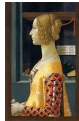
"Ritratto di Giovanna Tornabuoni", 1489-90, di Domenico Ghirlandaio.