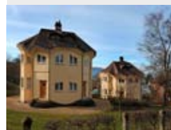
Case "Euritmia" del 1920, di Rudolf Steiner.

La mostra "Rudolf Steiner. L'alchimia del quotidiano", realizzata in collaborazione con il Vitra Design Museum e il museo di Stoccarda, è la prima grande retrospettiva dedicata al filosofo e pedagogista austriaco, uno dei riformatori più influenti e discussi del XX secolo. In mostra fotografie, documenti, opere d'arte, modelli e arredi.