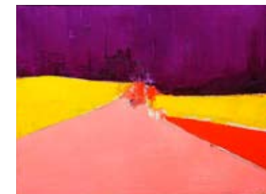
"Agrigento", 1954, olio su tela di Nicolas de Staël (1914-1955).

Il pittore e scultore Georges Braque (1882-1963) disse di lui: «La pittura è essenzialmente come l'amore. È schietta, è possente. E fu così per de Staël». Come lo racconta anche la retrospettiva "Nicolas de Staël, 1945-1955" che, con un centinaio