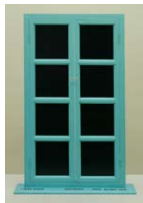
"Fresh Widow", 1920, replica 1964, di Marcel Duchamp (1887-1968).