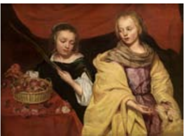
"Due ragazzine", olio su tavola di Michaelina Woutiers (circa 1620-1682).

Estro e fantasia, linee che si dissolvono in un cromatismo mosso e acceso, luci drammatiche dagli intensi chiaroscuri, una narrazione (pittorica) che si apre ai generi (dal paesaggio alla vanitas, alle nature morte...). Questi i cardini della poetica barocca che toccò vertici sublimi nella pittura fiamminga del Seicento. A raccontarlo è la rassegna "Rubens, van Dyck, Jordaens. Arte barocca da Anversa", che riunisce dipinti, disegni e stampe dei tre maestri e degli artisti che ne subirono l'influenza.