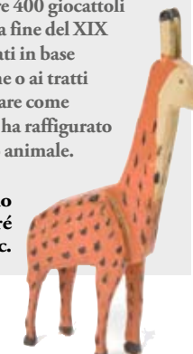
Giraffa in legno disegnata da André Hellé, Francia 1930 c.

Parigi Musées des Arts Décoratifs; tel. 0033-1-44555750. Dal 17 giugno al 17 ottobre. La rassegna "Piccole e grosse bestie" ha riunito oltre 400 giocattoli e giochi educativi dalla fine del XIX al XX secolo, selezionati in base alle particolarità fisiche o ai tratti psicologici, per illustrare come il mondo dei balocchi ha raffigurato la diversità nel mondo animale.