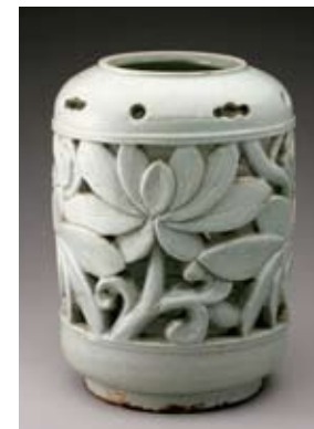
Fioriera in porcellana bianca con decorazioni incise, Corea, primo '800.

Le creazioni coreane della dinastia Joseon (1392-1910) sono, nella rassegna "Pura bellezza: la porcellana bianca della Dinastia Joseon e la serie 'Vessel' di Bonchang Koo", l'espressione dello stile di vita frugale ed essenziale promosso dall'ultima dinastia imperiale della Corea. Le opere in mostra sono affiancate a una serie creata dall'artista contemporaneo Koo (1953).